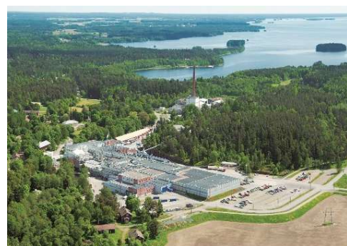
海外事業拠点（フィンランド）

所在地／〒101-0062 東京都千代田区神田駿河台4-6（御茶ノ水ソラシティ） 事業内容／紙、板紙、パルプ、液体用紙容器、機能性化成品、 機能性フィルムの生産・販売およびエネルギー事業 従業員数／ 単体 4,983人（2025年3月31日現在） 連結 15,145人（2025年3月31日現在） 資本金／1,048億73百万円 連絡先／人事部 新卒採用担当 E-mail／saiyou@nipponpapergroup.com